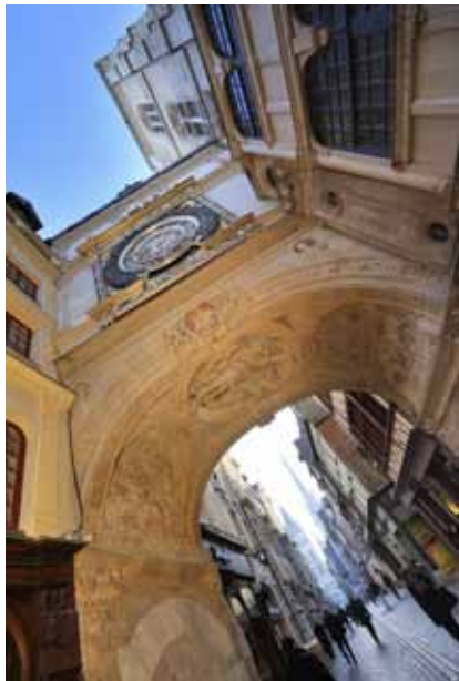
Het Grote Uurwerk symboliseert de rijkdom van de stad.