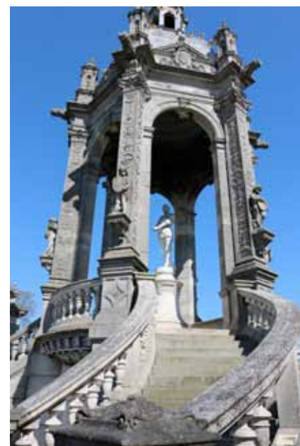
Het monument van Jeanne d'Arc op de Sint-Catharinaheuvel.

De historische binnenstad van Rouen is volledig autovrij, wat het aangenaam wandelen maakt