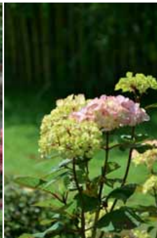
H. aspera 'Preziosa'.