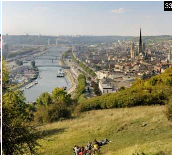
Vanop de Sint-Catharinaheuvel heb je een prachtig uitzicht over de stad.

stenen, daarna is men de hele benedenverdieping in steen gaan optrekken. Op die manier vat bij een brand niet onmiddellijk het hele huis vuur. De huizen zijn hier trouwens opvallend hoog, met meestal vier verdiepingen.”