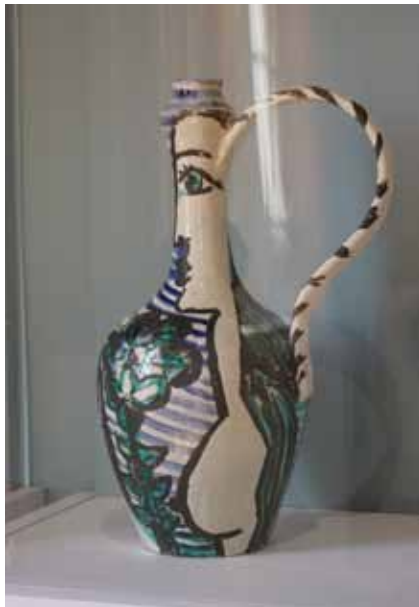
Picasso blonk ook uit in de keramische kunst.