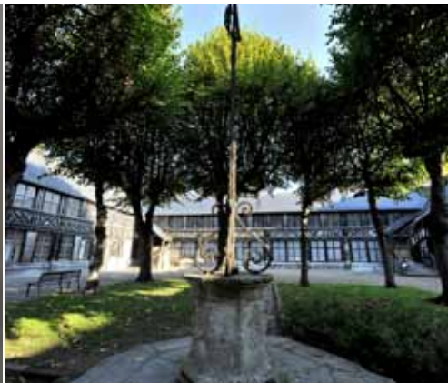
Een rustige plek, het kerkhof van Saint-Maclou.

In het Panorama XXL word je gecatapulteerd naar de middeleeuwen en beleef je samen met Jeanne d'Arc haar laatste ogenblikken