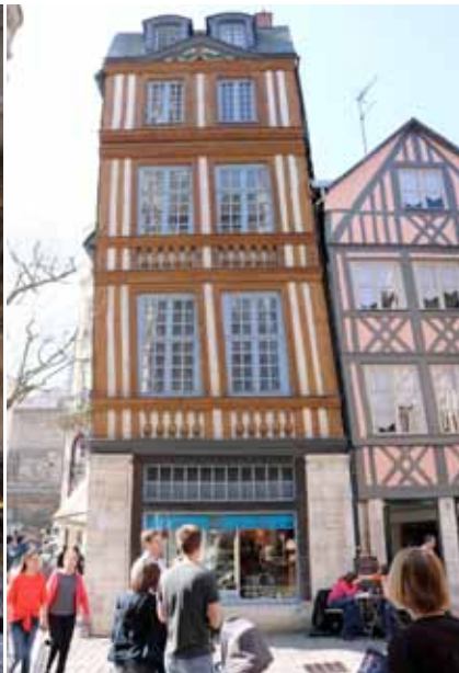
Sommige middeleeuwse panden zijn volledig scheefgezaakt.