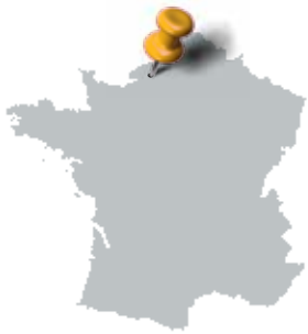
Brussel > Rouen: 352 km.

Jeanne d'Arc belandde er op de brandstapel. Talrijke impressionisten bivakkeerden er tijdelijk. We bevinden ons in hartje Normandië, in de opvallend levendige stad Rouen. Nochtans spatten de middeleeuwen hier van iedere gevel. Loop met ons door het doolhof van straatjes en pleintjes in deze, een beetje miskende, doch zwaar beladen historische stad die zoveel te bieden heeft.